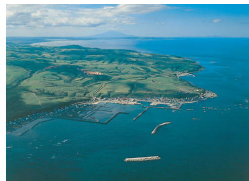
宗谷丘陵 (北海道遺産)