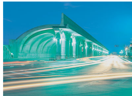
稚内港北防波堤ドーム (北海道遺産)